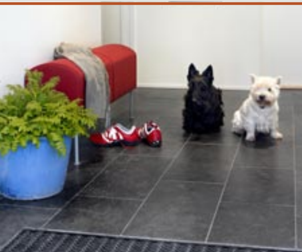
Flis i Ottaskifer med børstet overflate.