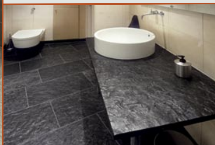
Flis og benkplate i Ottaskifer med børstet overflate,