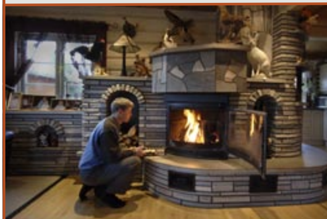
Mursten/stov og bruddheller i Oppdalskifer.