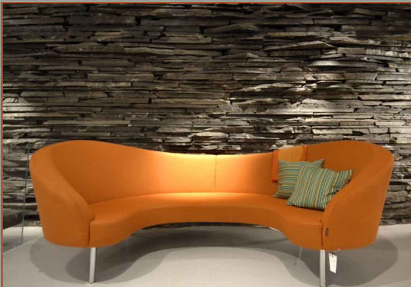
Tørrmur (10-30 cm) i Alaskifer til forblending.