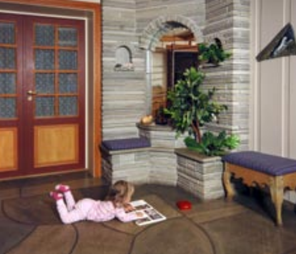
Mursten og bruddheller (gulv) i Oppdalskifer.