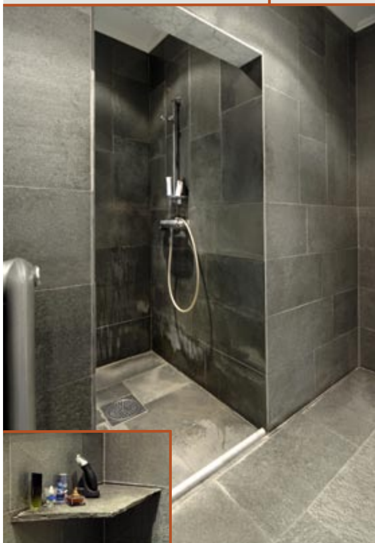
Flis i Offerdalskifer med slipt overflate, Innfelt: Hylle i Offerdalskifer.