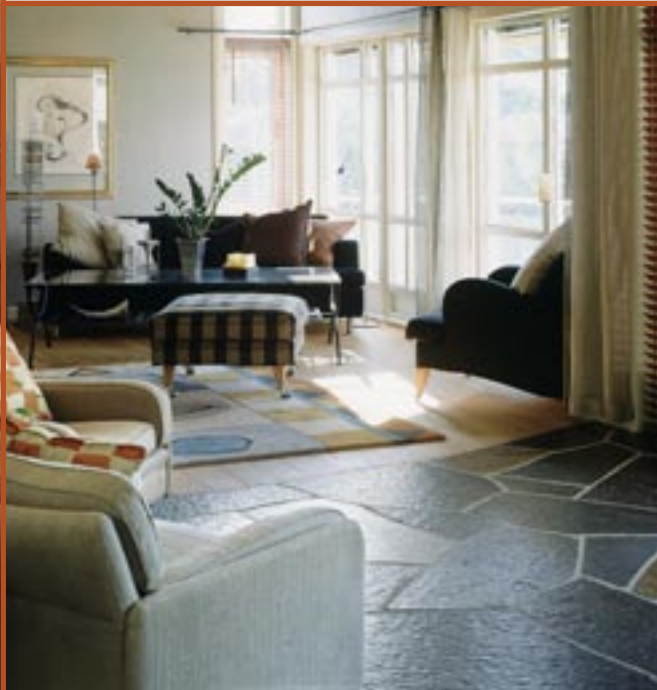
Bruddheller i Ottaskifer (Pillarguri og rust)