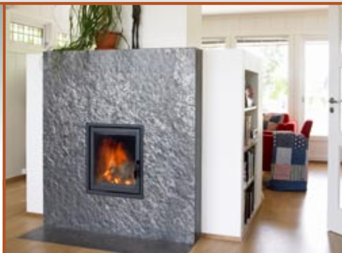
Peis med Ottaskifer - natur overflate.

Skifer skaper helhet og harmoni sammen med andre materialer. Interiøret er ikke bare til beskuelse, det skal tåle vår daglige bruk