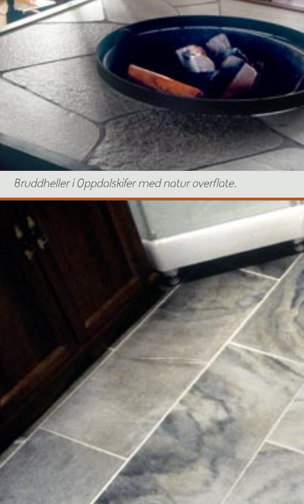
Flis (gulv) i Oppdalskifer med slipt overflate.