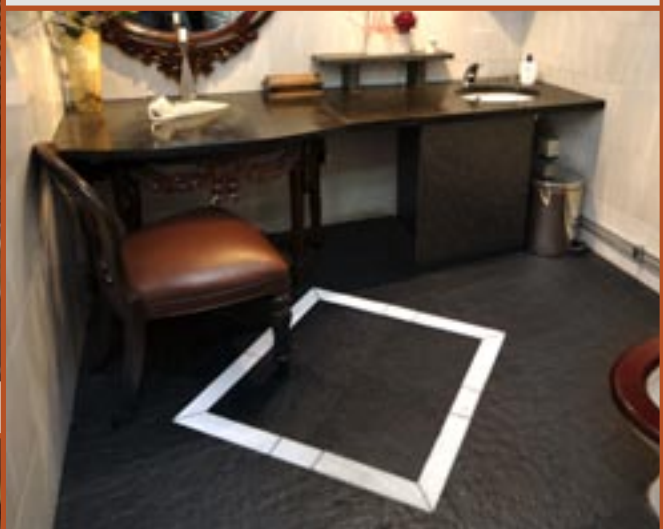
Flis i Ottaskifer, børstet i gulv og slipt benkflate.