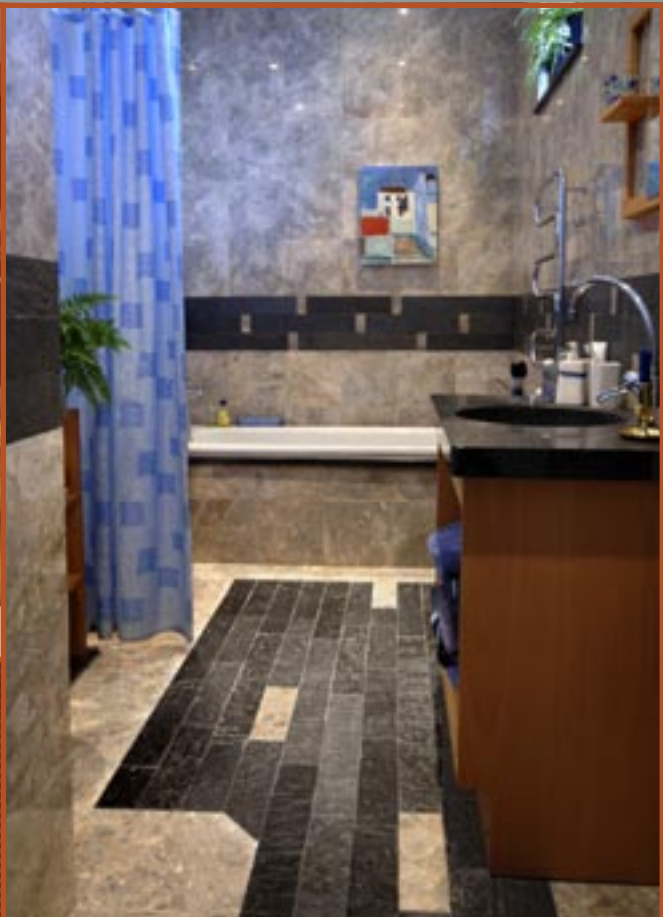
Flis i Ottaskifer (natur) i gulv og veggdekor og slipt benkplate.