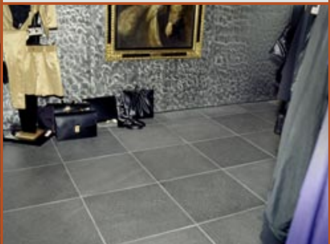
Flis i Altaskifer med natur overflate.