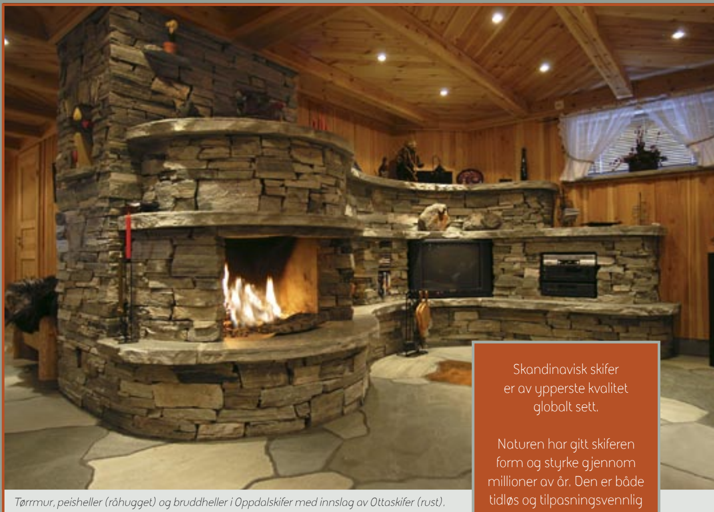
Tørrmur, peisheller (råhugget) og bruddheller i Oppdalskifer med innslag av Ottaskifer (rust).

Skandinavisk skifer er av ypperste kvalitet globalt sett.