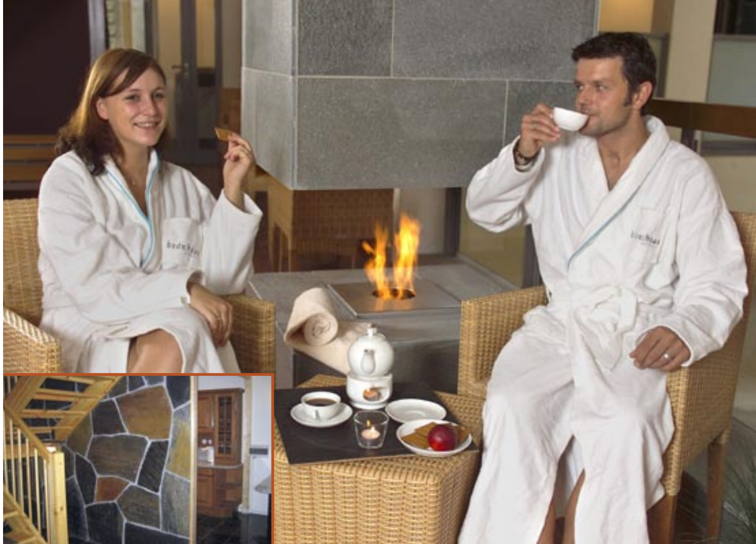
Bruddheller til forblending i Ottaskifer (Pillarguri og rust).