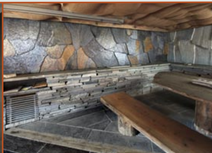
Bruddheller i Ottaskifer (Pillarguri og rust) og tørrmur i Oppdalskifer.