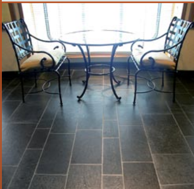
Flis i Ottasaker (Pillarguri) med slipt overflate.