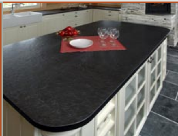
Benkplate i Ottaskifer (Pillarguri) med slipt overflate.

Skiferen tåler alle påkjenninger i vår daglige bruk - livet ut. Overflaten er vakker og vedlikeholdsfri.