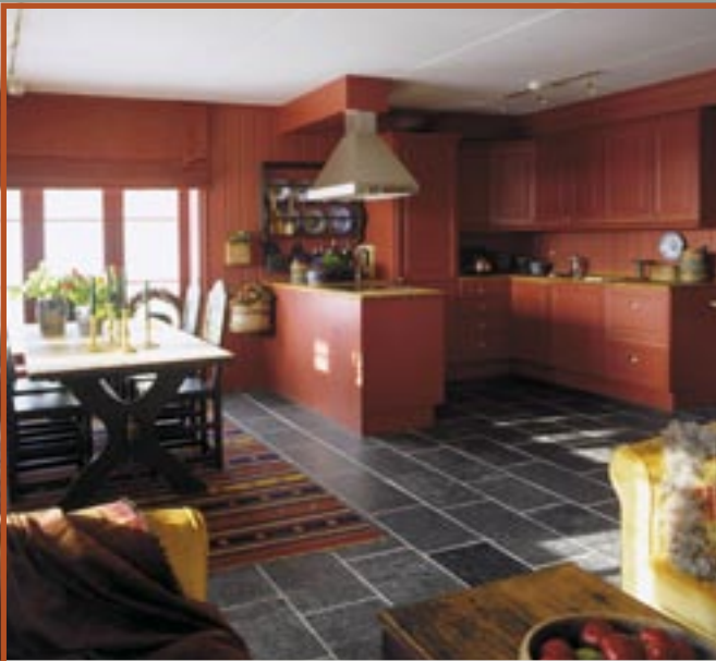
Flis i Ottaskifer med børstet overflate.