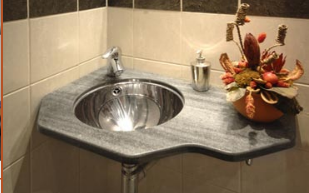
Benkeplate i Oppdalskifer (mørk) med slipt overflate.

Skandinavisk skifer er slett ikke ensfarget grå og trist. Fargespillet i skifer er unikt og spesielt. Materialtet har alle positive miljøfaktorer og er blitt en eksportvare i betydelig målestokk.